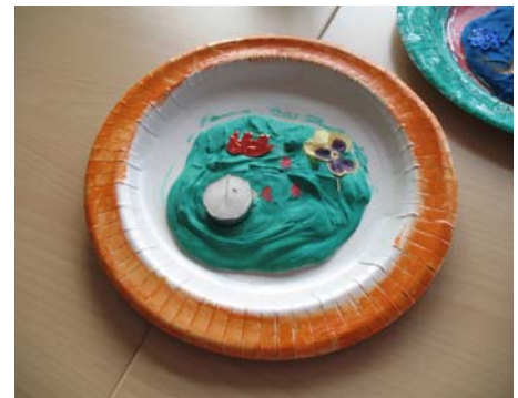
Bastelergebnisse einzelner AGs